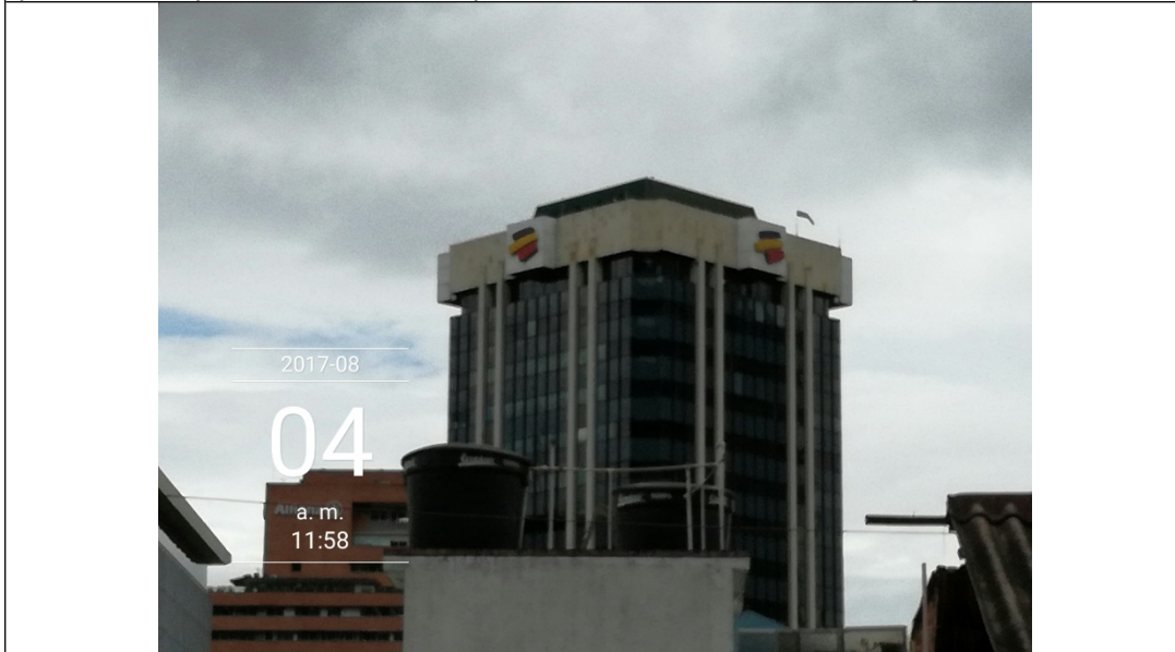
Fotografía No. 3 Vista panorámica del establecimiento de comercio TORRE BANCOLOMBIA, ubicado en la CARRERA 7 No. 31 - 10, el cual cuenta con elementos publicitarios tipo aviso en fachada que no cuentan con solicitud de registro.